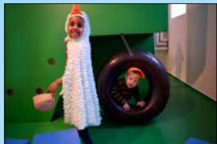
Maskinhallen med bl.a. skæve trapper, sanserør, rutchebane og et "teknikrum", hvor børnene kan lege at de styrer en maskine.