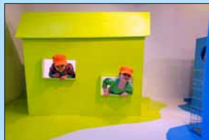
Bondehuset med dukker og køkkenting, så børnene kan lege at de er familien på gården.