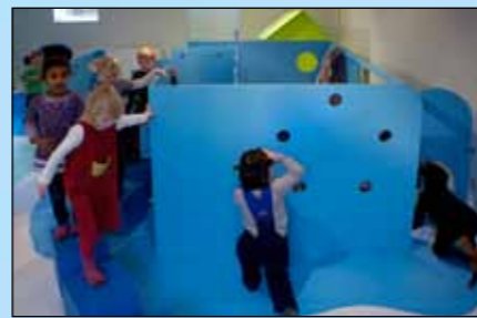
Stalden , hvor der bl.a. er spande, trug og kostumer, så børnene kan lege, at de er dyrene på en bondegård.

De forskellige elementer er samtidig udformet, så børnene opfordres til blandt andet at kravle, hoppe, gyng og gemme sig.